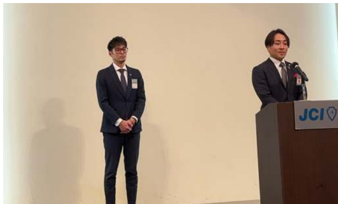
福岡ブロック協議会 22LOM協働委員会