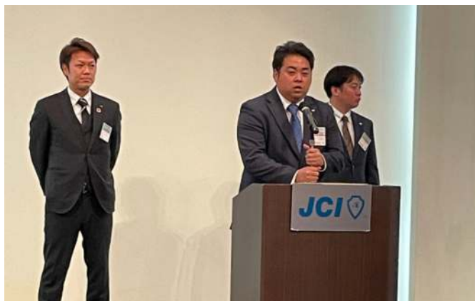
福岡ブロック協議会 地域経済活性化委員会