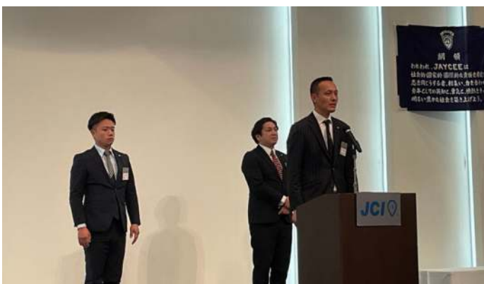
日本青年会議所 組織グループ JC教育推進委員会