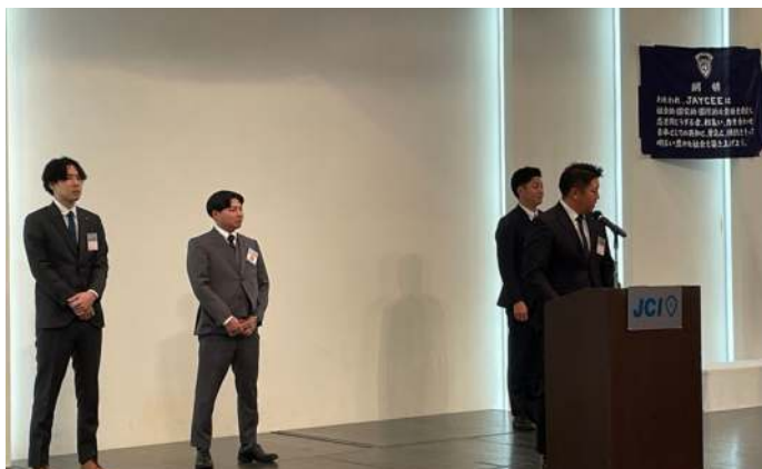
日本青年会議所 組織グループ JC未来創造会議