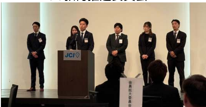
福岡ブロック協議会 アカデミー委員会